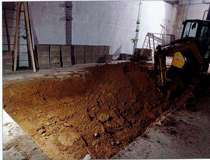
Der Pool entsteht, die Görlitzer Jugendfeuerwehr wird ihn später fluten und schließlich der erschossene Gatsby darin schwimmen