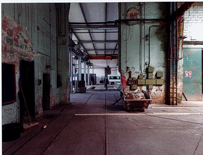
Das stillgelegte KEMA-Fabrikgelände wurde in eine Welt der Zwanzigerjahre verwandelt. Fotos: André Winkelmann [2]