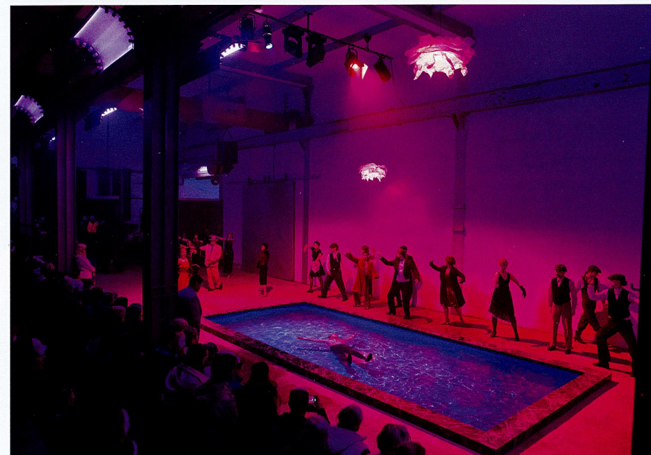
Da ist es passiert. Zuvor war weithin ein Schuss zu hören und wer sich im immersiven Theaterlabyrinth nicht verirrt hat, sieht dieses [Beinahe-]Schlussbild.

Bei „Malfi!“ lobten Sie Ihre Kollegen der Bühnentechnik in den höchsten Tönen. Wie haben die Mitarbeiter diesmal mitgezogen? Allein die Spielfläche von „Gatsby!“ umfasst etwa 4500 m² und ist damit fast doppelt so groß wie bei „Malfi!“.