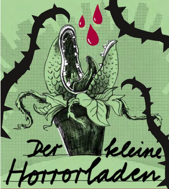
Musical von Alan Menken und Howard Ashman | PREMIERE am 02. März

Theaterkassen: Theater Zittau – Theaterring 12 | Theater Görlitz – Demianiplatz 2 Tel.: 03581 474747 | E-Mail: service@g-h-t.de NEUE ÖFFNUNGSZEITEN seit 01.01.2019: Di bis Fr 10:00 – 13:00 Uhr und 14:00 – 18:00 Uhr | Sa 10:00 – 12:30 Uhr | Die Abendkassen an den Vorstellungsorten öffnen eine Stunde, im Apollo Görlitz (Hospitalstr. 2) 30 Minuten vor Vorstellungsbeginn. An den Abendkassen sind keine Reservierungen möglich. Vorverkaufsstellen in und um Zittau: Tourismuszentrums Naturpark Zittauer Gebirge im Rathaus – Tel. 03583 752200 | SZ-Treffpunkt Zittau – Tel. 03583 77555870 | CD Studio Zittau – Tel. 03583 704200 | Reisebüro Herrnhut – Tel. 035873 40789 | Tourist-Information Löbau – Tel. 03585 450140 | Naturparkhaus Waltersdorf – Tel. 035841 2146 | Tourist-Information Jonsdorf – Tel. 035844 70616